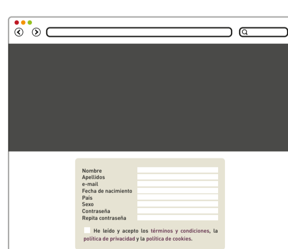
Casilla en un formulario

RECUERDA INCLUIR UN ENLACE A OTRA PÁGINA EN LA QUE SE FACILITE UNA INFORMACIÓN MÁS DETALLADA Y SE PERMITA AL USUARIO RECHAZAR LA INSTALACIÓN DE LAS COOKIES.